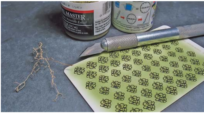
1. Potrzebne narzędzia i materiały.