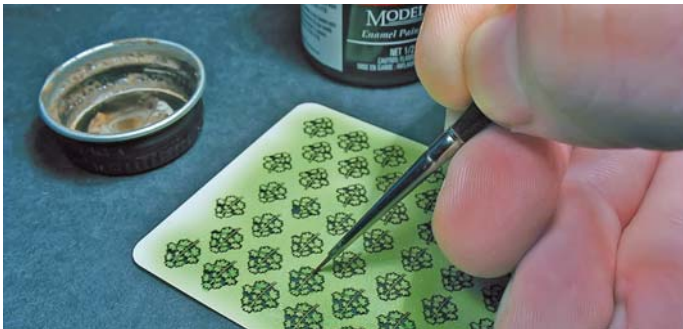
3. Drobne gałązki akcentujemy za pomocą brązowej farby.

2. When the green is airbrushed you can add the darker shades. It is worth to make the differences between colours to break the monotony of the one that was used first.