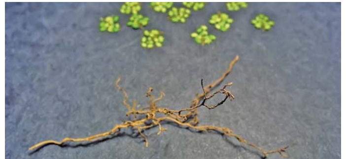
6. Małe korzenie po oczyszczeniu i wysuszeniu idealnie nadadzą się jako imitacja gałęzi.

6. The little roots are perfect for the foliage. They need to be cleaned and dried them.