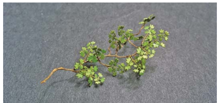
8. Efekt końcowy.

7. The CA glue is the best solution to make a hard and quickly drying joint.