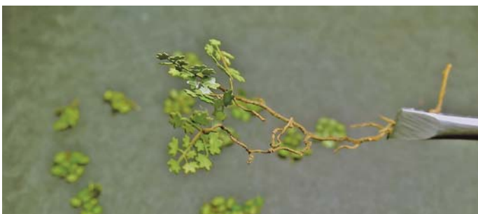
7. Całość sklejamy za pomocą kleju cyjanoakrylowego. Da nam to mocną i szybką spoinę.

6. The little roots are perfect for the foliage. They need to be cleaned and dried them.