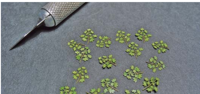
5. Listki gotowe do montażu na gałęziach.