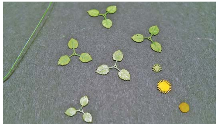
6. Części składowe.