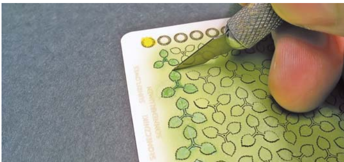
5. Ostrożnie wycinamy poszczególne elementy. 5. Cut the parts very carefully.