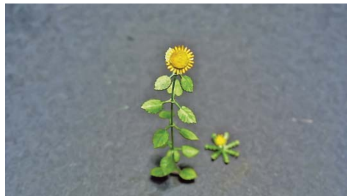
8. Gotowy słonecznik i bonusowy mleczyk.