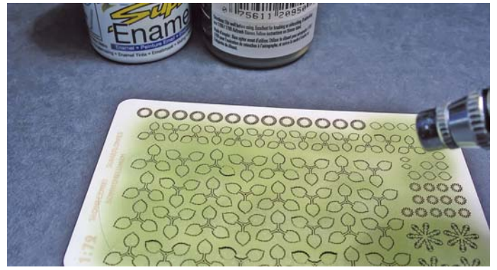
2. Przy pomocy aerografu natryskujemy jasny zielony. Pamiętajmy, że to tylko baza pod dalsze prace malarskie. 2. Airbrush the green to make a base for the next shades.