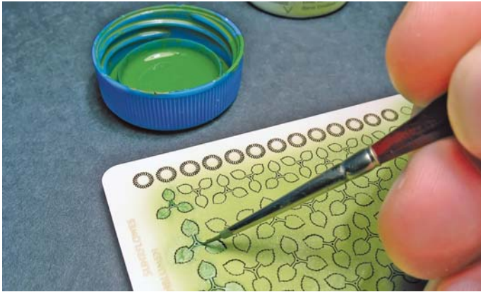
3. Teraz ciemniejszym odcieniem zaznaczamy strukturę liścia i przebarwienia. To ważne! Dzięki temu złamiemy „płaskość” oraz monotonię koloru.