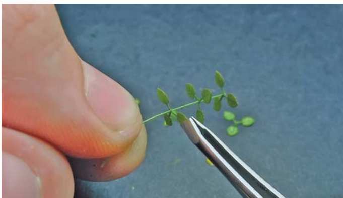
7. Nawlekamy listki zabezpieczając je odrobiną kleju nadając im odpowiedni kształt.